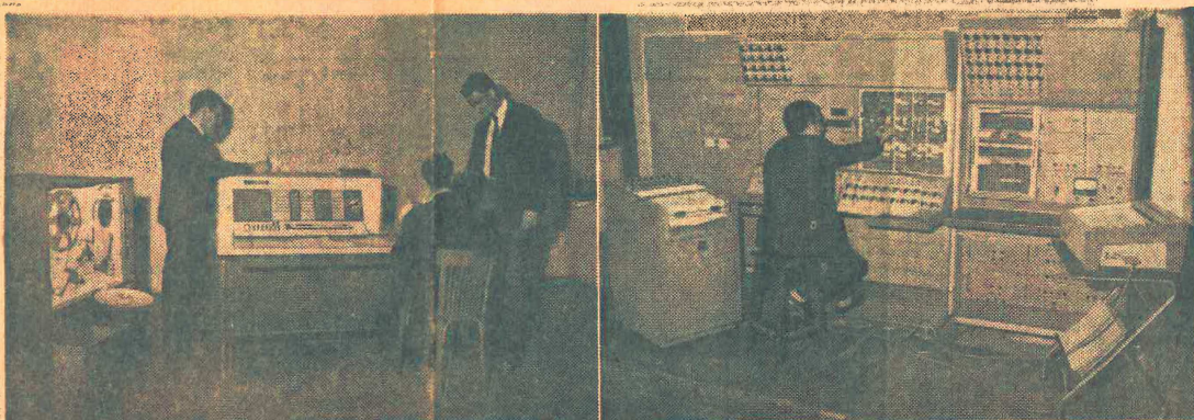
A la izquierda, el ordenador digital que está en funcionamiento hasta las horas de la noche. A la derecha, los dos calculadores analógicos, que pueden trabajar unidos o separados.